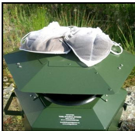
Knottfangsten etter 4 dagar i juli 2006.

Prisar frå 20.03.2007, inkl. mva. Ev. frakt, gass og octenol kjem i tillegg til felleprisen.