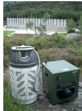
Midg-it på Gulatinget

Tilbakemeldinga i fjor etter to sesongar med 15 feller i drift på Tusenårsstaden, var svært positiv.